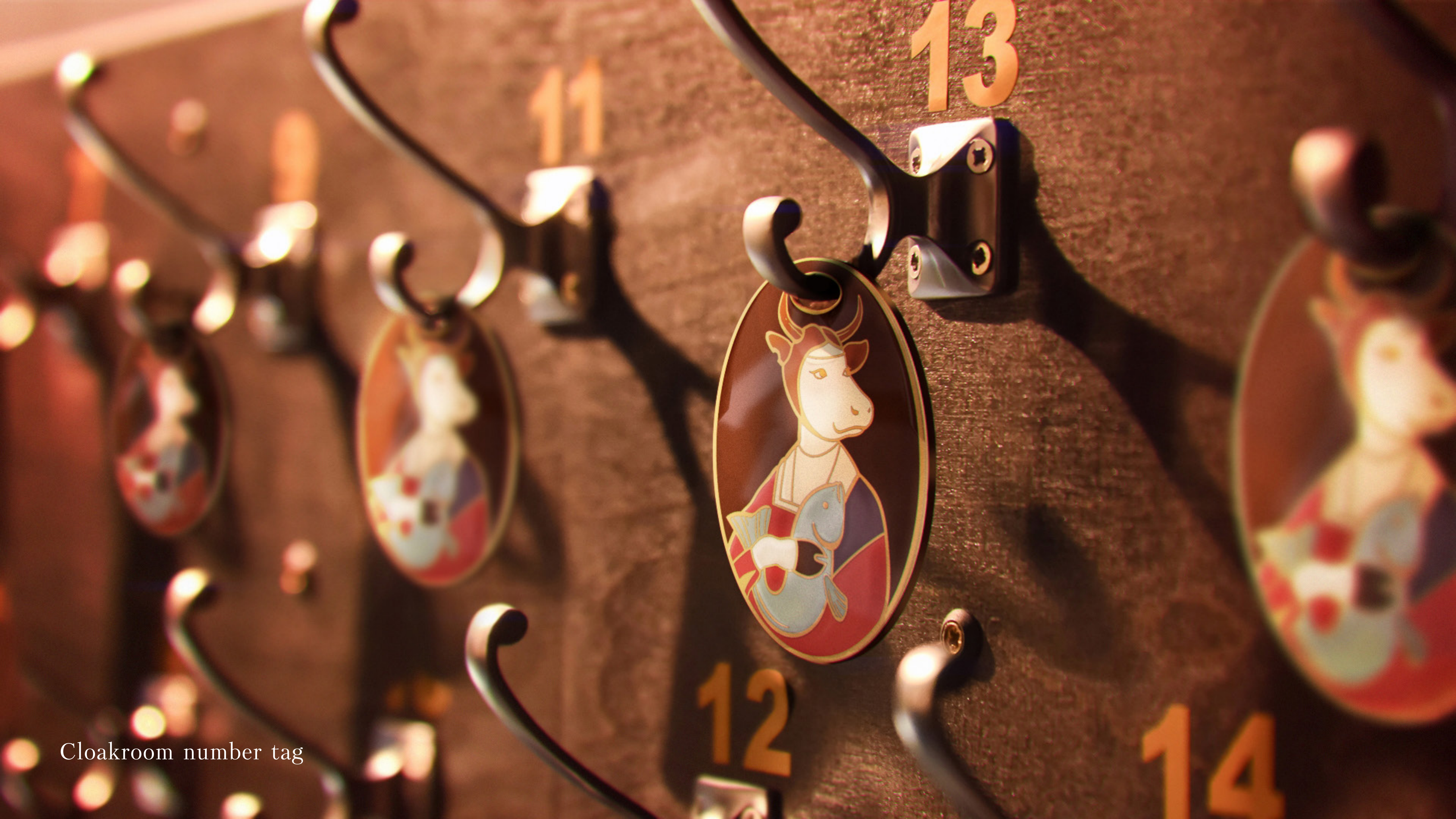
Cloakroom number tag